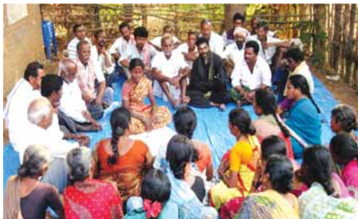
స్వయం సమీక్ష నిర్వహించుకుంటున్న పేరంటాల నీటి వినియోగదారుల సంఘం, సాంబయ్యగూడెం, మనుగూరు మండలం, ఖమ్మం జిల్లా