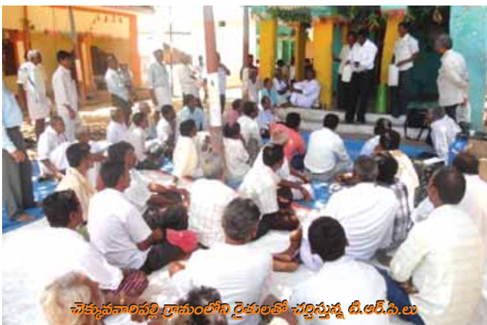
చెక్కువనాదిపల్లి గ్రామంలోని రైతులతో చేర్చిస్తున్న టి.ఆర్.పి.లు

అనంతపురం జిల్లా, కదిరిలోని మైరాడ సంస్థలో భూగర్భజల యాజమాన్య కార్యక్రమాలను చెరువు స్థాయిలో నిర్వహించుటకు ఎంపిక చేయబడిన 12 మంది సిబ్బందికి 3 రోజుల పాటు శిక్షణా కార్యక్రమం నిర్వహించడం జరిగినది. ప్రాజెక్టు లక్ష్యాలు మరియు సక్రమ నీటి యాజమాన్య ఆచరణలో భాగస్వామ్య భూగర్భజలాల యాజమాన్య పాత్ర గురించి అవగాహన కల్పించడం జరిగినది.