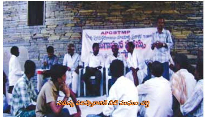
సమస్య పరిష్కారానికి నీటి సంఘం చర్చ

నీటి వినియోగదారుల సంఘసభ్యులలో ఇంతటి గణనీయమైన మార్పును తీసుకొని వచ్చినందుకు నీటి వినియోగదారుల సంఘము అధ్యక్షుడు సహాయసంస్థ సిబ్బందిని మరియు ప్రాజెక్టు సిబ్బందిని మనస్ఫూర్తిగా అభినందించారు.