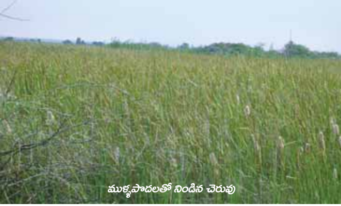
ముళ్ళపాదలతో నిండిన చెరువు

హెూత్రమదిన్నె, కర్నూలు జిల్లాలోని సంజామల మండలంలోని ఒక చిన్న గ్రామము ఇది జిల్లా కేంద్రము కర్నూలుకు 120 కి.మీ. దూరములో వున్నది. గ్రామజనాభా 305. ఈ గ్రామానికి పాలేరు ఆనకట్ట అనే చెరువు వుంది. దీని క్రింద 160 ఎకరాలు ఆయకట్టు వున్నది. ఈ ఆయకట్టు హెూత్రమదిన్నె మరియు వసంతపురం గ్రామాల రైతులకు చెందినది.