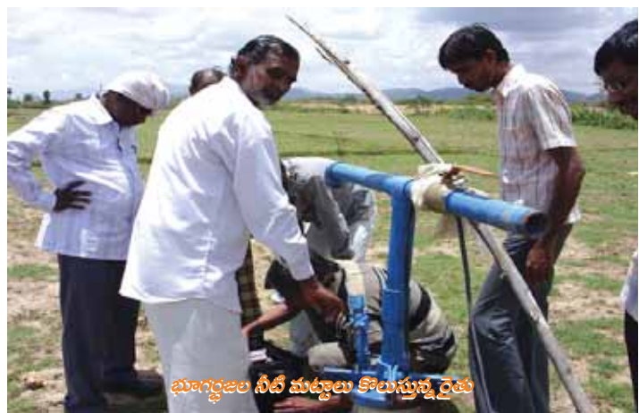
భూగర్భజల నీటి మట్టాలు కొలుస్తున్న రైతు

ఆంధ్రప్రదేశ్ సమాజ ఆధారిత చెరువుల యాజమాన్య పథకంలో భాగంగా, భాగస్వామ్య భూగర్భజల యాజమాన్య కార్యక్రమాల అమలుకు ఈ చెరువు ఎంపికైంది. ఇందులో భాగంగా భూగర్భజల శాఖ వారు ఐదు బోర్లను పరిశీలన బోర్లుగా ఎంపిక చేశారు.