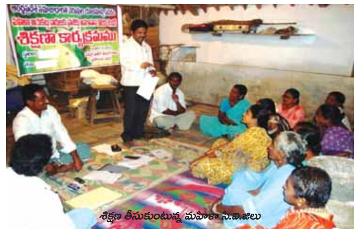
శిక్షణ తీసుకుంటున్న మహిళా స.బి.జిలు

ట్రైబల్ అభివృద్ధి ప్రణాళికలు: ట్రైబల్ రైతులను చెరువు యాజమాన్యంలో సాధికారత సాధించటానికి మరియు వారి ఆదాయాన్ని పెంపొందించటానికి జీవనోపాధుల ఆధారిత నిధిని ఏర్పాటు చేయడం జరుగుతుంది. ఈ కార్యక్రమం క్రింద 10 జిల్లాలను గుర్తించి 77 ట్రైబల్ కమిటీలను ఏర్పాటు చేయటం జరిగింది. వాటిలో 47 ట్రైబల్ అభివృద్ధి ప్రణాళికలకు అనుమతులు ఇవ్వడం జరిగింది. ప్రతి ఒక ట్రైబల్ అభివృద్ధి కమిటీ జీవనోపాధుల నిధి క్రింద రూ. 50,000/- పొందటానికి అర్హత ఉన్నది. ట్రైబల్ అభివృద్ధి కమిటీలు చెరువు యాజమాన్యంపై శిక్షణలు తీసుకొని కృషి విజ్ఞాన కేంద్రం పరిధిలో నిర్వహించిన వ్యవసాయ ప్రదర్శన పద్ధతులపై క్షేత్ర పర్యటనకు వెళ్లటం జరిగింది.