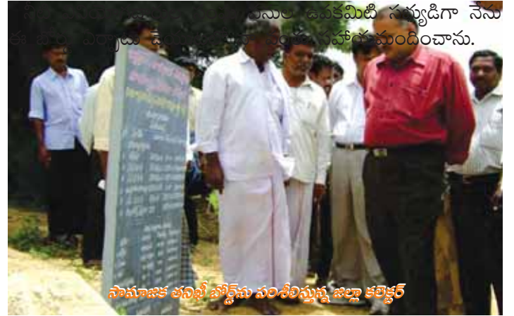
సామాజిక తనిఖీ బోర్డును పంపిణీస్తున్న జిల్లా కలెక్టర్

ఎంతవని చేయబడినది అనే విషయాన్ని నులభంగా తెలుసుకొంటున్నారు.