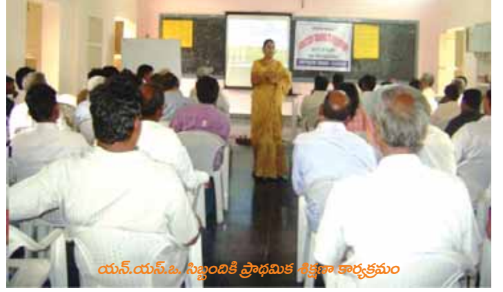
యస్.యస్.ఓ. సిబ్బందికి ప్రాథమిక శిక్షణా కార్యక్రమం

నీటి వినియోగదారు సంఘములను వ్యవస్థాగతంగా, సాంకేతిక పరంగా మరియు ఆర్థిక పరమైన సుస్థిరతను తీసుకురావడం, ప్రత్యేకించి నీటిపన్ను వసూలు చేయడంలో పర్యవేక్షణ, కార్పస్ ఫండ్ పెంపొందించడం ద్వారా మరియు నీటి వినియోగదారుల సంఘం నిర్వహణ, పునరుద్ధరించబడిన చెరువుల పర్యవేక్షణ మరియు నిర్వహణ, ఉత్పాదకత పెంపుదల మరియు సక్రమ నీటి వినియోగం ద్వారా నీటి వినియోగదారుల సంఘములలో వ్యవస్థాగత సుస్థిరతను తప్పనిసరిగా తీసుకురావడమే నోడల్ సహాయ సంస్థల ప్రధాన విధి. ప్రాంతీయ కేంద్రాలలో 275 నోడల్ సహాయ సంస్థల సిబ్బందికి ప్రాథమిక శిక్షణను ఆరుబ్యాచ్లుగా ఇవ్వడం జరిగింది. శిక్షణా సమయంలో ప్రాజెక్టు మేనేజ్మెంట్ యూనిట్ నిపుణులు మరియు జిల్లా ప్రాజెక్టు యూనిట్ సిబ్బంది ప్రాజెక్టులోని ప్రతి అంశమును లోతుగా చర్చించడం జరిగింది. నోడల్ సహాయ సంస్థల సిబ్బంది యొక్క విధులు మరియు బాధ్యతలను నాలుగు గ్రూపులుగా ఏర్పడి చర్చించడం జరిగినది. శిక్షణా