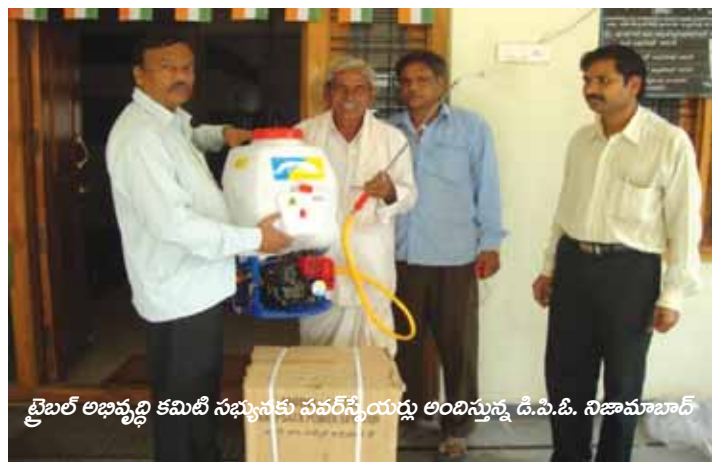
ట్రైబల్ అభివృద్ధి కమిటీ సభ్యులకు పవర్ స్టేషన్లు అందిస్తున్న డి.పి.సి. నిజామాబాద్

మహిళా అభివృద్ధి ప్రణాళికలు: ఈ కార్యక్రమం క్రింద మహిళా ఆయకట్టుదారుల సాధికారతకు వ్యవసాయ ఆధారిత జీవనోపాధుల సహాయసేవల కార్యక్రమాల క్రింద జీవనోపాధుల నిధిని అందించటం జరుగుతుంది. ఈ కార్యక్రమం క్రింద 16 జిల్లాలను ఎంపిక చేసి మహిళా ఆయకట్టుదారులలో 353 సి.బి.జి.లను ఏర్పాటు చేయటం జరిగింది. ఈ సి.బి.జి.లో 126 ఆదాయ అభివృద్ధి ప్రణాళికలను తయారుచేసి అనుమతుల కొరకు ప్రాజెక్టు యాజమాన్య యూనిట్ కు పంపించటం జరిగింది. ఏర్పాటు చేసిన అన్ని సి.బి.జి.లు జండర్ అంశాలపై చెరువు వ్యవస్థ అభివృద్ధి మరియు వ్యవసాయ జీవనోపాధుల సహాయసేవల కార్యక్రమాలపై శిక్షణలు తీసుకోవటం జరిగింది. ప్రతి మహిళా సి.బి.జి జీవనోపాధుల నిధి క్రింద రూ.50,000/- పొందటానికి అర్హులు.